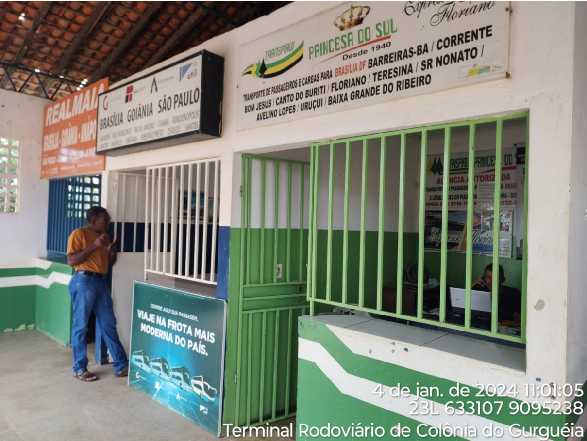
Terminal Rodoviário de Colônia do Gurgueia

4 de jan. de 2024 11:01:05 23L 633107 9095238